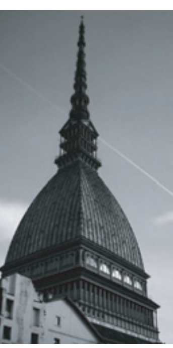
Torino ha ospitato l'assemblea dei Comuni

Sono stati sicuramente due giorni interessanti quelli che hanno impegnato il nostro Sindaco al Lingotto Fiere di Torino, in compagnia di altri 20 Sindaci friulani, alla XXVI Assemblea Generale dell'Associazione Nazionale dei Comuni Italiani. Molti sono stati i temi trattati, a partire dal federalismo fiscale. Il Sindaco Chiamparino, rieletto presidente, ha assicurato tutto il suo impegno affinché i comuni siano protagonisti del processo di rinnovamento federalista nel quadro di un rafforzamento dell'identità nazionale. L'intervento del presidente della Camera Fini ha sottolineato come il futuro sia affidato agli amministratori degli oltre ottomila Comuni italiani. Ma, riferisce il nostro sindaco credo che alla luce delle ultime proposte legislative su riordino degli enti locali, privatizzazione dell'acqua ecc., si stia andando in tutt'altra direzione. Si toglie infatti autonomia e forza ai comuni che sono in assoluto gli enti più vicini ai problemi dei cittadini e che, in questi anni, hanno sempre fatto la loro parte per il contenimento della spesa. Si cominci invece a rimborsare l'ICI, mai incassata dai Comuni e sempre promessa da questo Governo. ■