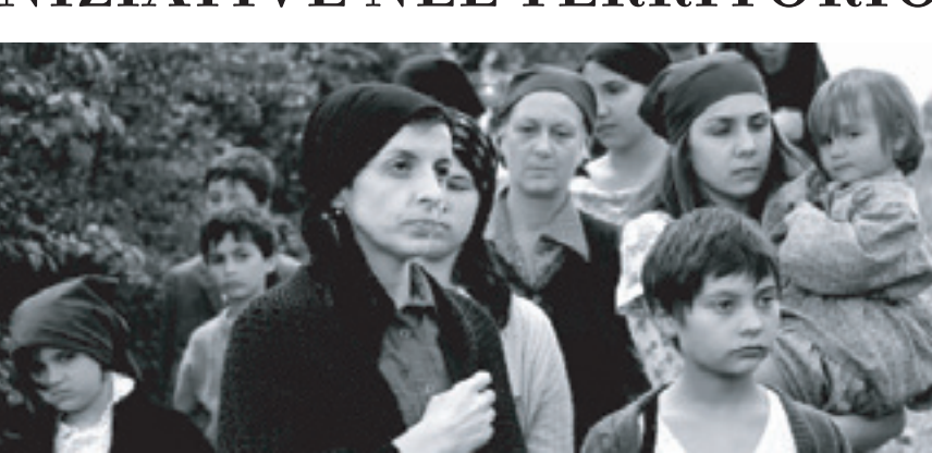
Una scena del film Il Sole tramonta a mezzanotte

L'Amministrazione sta lavorando a stretto contatto con le locali associazioni